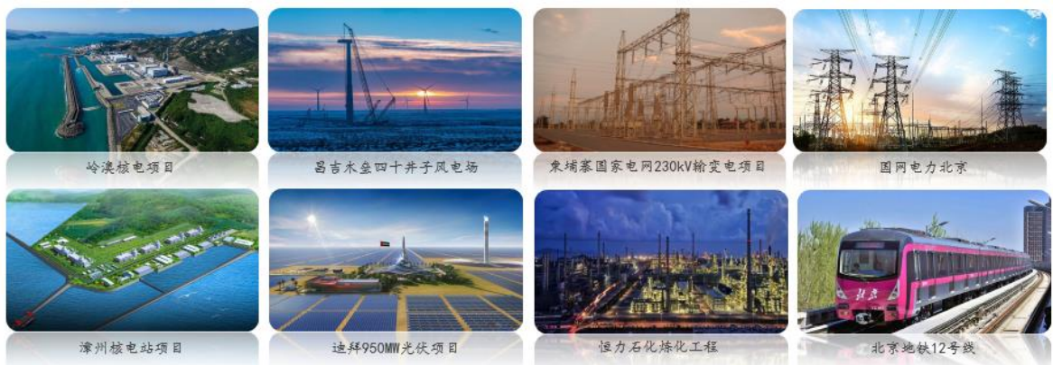
图 2：报告期内公司部分服务项目

报告期内，公司实现营业收入 100,669.30 万元，较上年同期下降 4.17%。公司在核电及新能源市场领域电缆销售收入为 2.13 亿元，同比增长 7.02%。轨道交通、电力装备、钢铁和化工等市场领域一直是公司业绩增长的重要动力。多年来，公司专注于这些领域的研发和生产，以优异的产品性能和高质量的产品品质在客户中深受好评。报告期内，公司在轨道交通、电力装备、钢铁、化工等市场领域销售收入 6.04 亿元，其中，公司在电网市场实现了销售规模化的突破。未来，公司将抢抓电力电缆市场增长的机遇，不断提升公司在电网市场的市场占有率，提升公司的综合竞争实力。