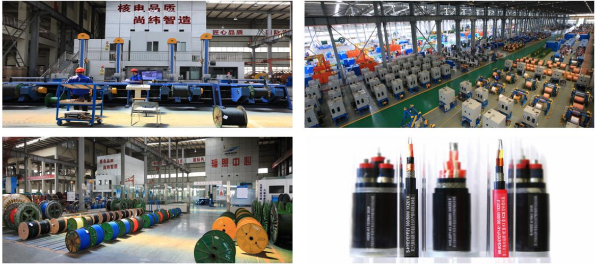
图 1：公司生产车间、主要产品